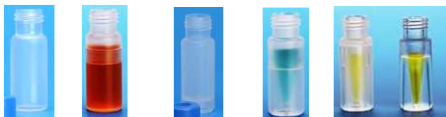
1.7mL ツープース 700uL 500uL 100uL (クリア) (TPX)

※ ポリメチルペンテン (TPX)は透明度が高く、樹脂由来の溶出が少ないため、LC/MSに向いています。