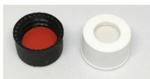
セブタムインキャップ