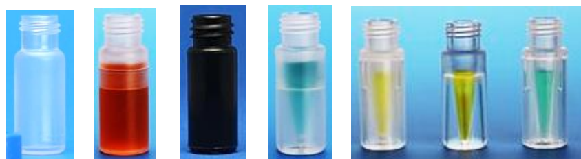
1.7mL ツープース ブラック 500uL 100uL (クリア) (TPX) (クリアCP)