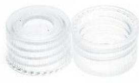
モールドキャップ