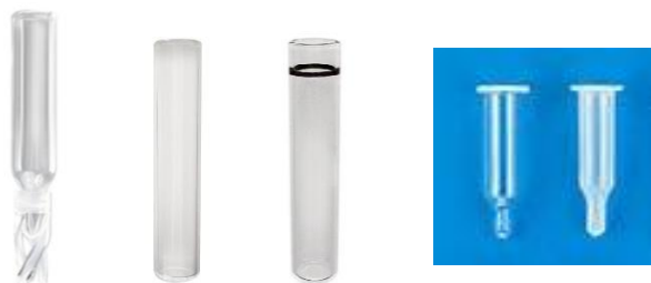
ボトムスプリング フラット フラットIDリング コニカル